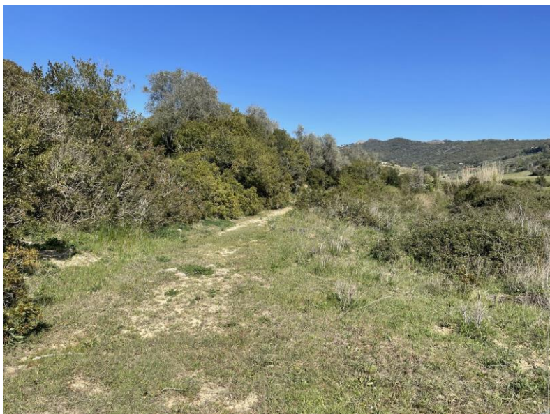
Figura 1. Habitat di raccolta di Conwentzia psociformis sull'isola d'Elba.